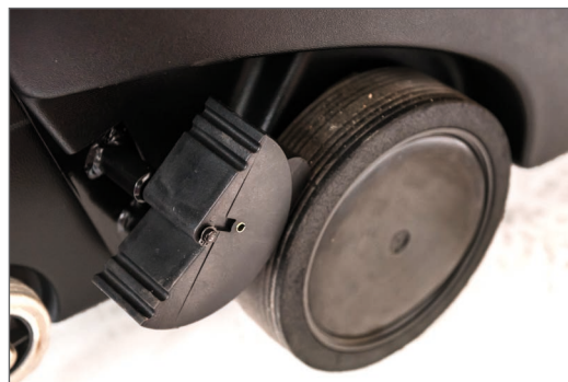
Large roue équipée de frein